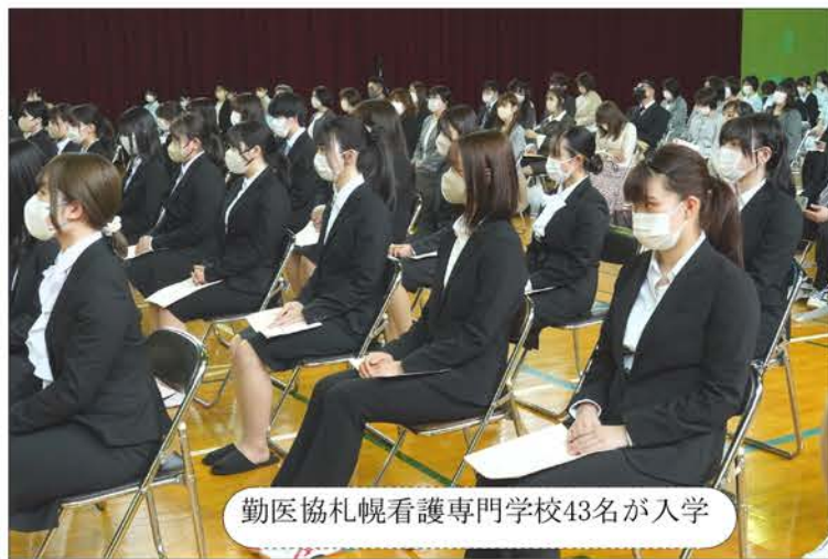
勤医協札幌看護専門学校43名が入学