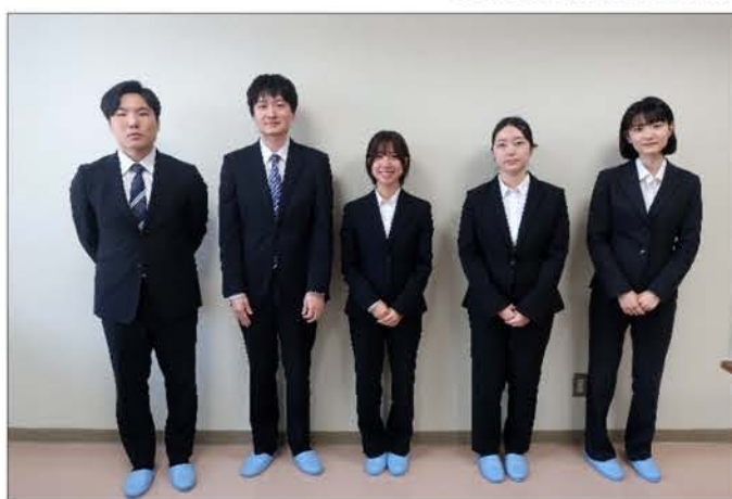
北海道保健企画/ひまわり薬局 薬剤師3名 事務員2名