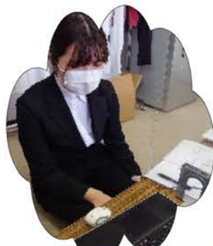
ふしこ 歯科衛生士