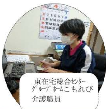
東在宅総合センター グループホームこもれば 介護職員