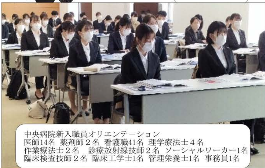
中央病院新入職員オリエンテーション 医師14名 薬剤師2名 看護職41名 理学療法士4名 作業療法士2名 診療放射線技師2名 ソーシャルワーカー1名 臨床検査技師2名 臨床工学士1名 管理栄養士1名 事務員1名