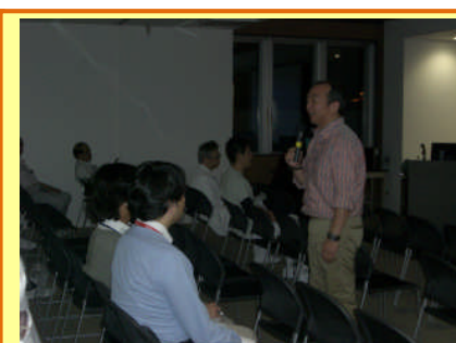
マイクを持って会場をウロウロ