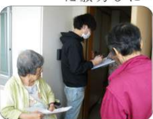
会員と職員と一緒に

10条クリニックでも対話広がる 10条クリニックでは9月5日と10月3日に伏古地域をいっせいで訪問しました。行動には10条クリニック、新道ひまわり薬局、ふしこ歯科の職員と友の会員42名が参加、219軒のお宅を訪問し、58軒から地震の影響や、何か生活で困ったことがないかなどを伺うことができました。未だに地震の揺れのようななまめいを感じていると不安を話す方もいました。 みなさんへお願い 友の会に入会していただける方をご紹介ください 友の会事務局 011-782-3317 まで