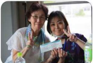
会員が増えました

「友の会活動拡大強化月間」では、職員と友の会が地域訪問をおこない、すでに1000軒を超えています。今年9月6日に発生した北海道胆振東部地震での被害の状況などのアンケートも実施しています。アンケートの中には「地震後から子供の体調があまり良くない」「今回の停電は短い時間だから良かったが、長い間停電になっていたら心配だ」などの切実な想いが聞けたほか、「テレビのテロップで中央病院が何度も流れていて感動した」「中央病院は地震が起きても診療を継続して助かった」などの感謝の気持ちを聞くことができました。引き続きアンケートをおこなってまいります。参加した職員からは「地域で