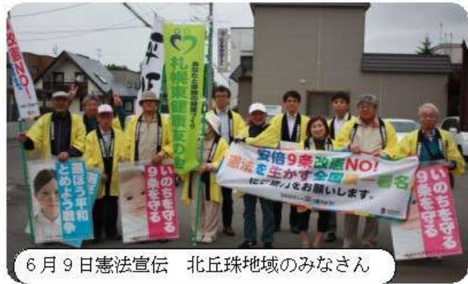
6月9日憲法宣伝 北丘珠地域のみなさん

これからも、目標の3000万人達成をめざします。みなさんのご協力を引き続きお願いいたします。