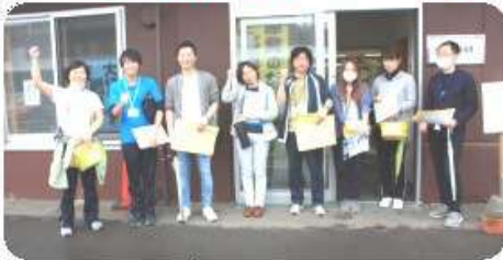
元気に 団地訪問へ GOO!